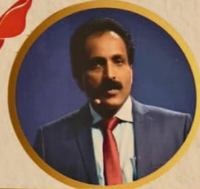
Felicitaton to Dr. Sreedhara Panicker Somanath Honourable Chairman, ISRO